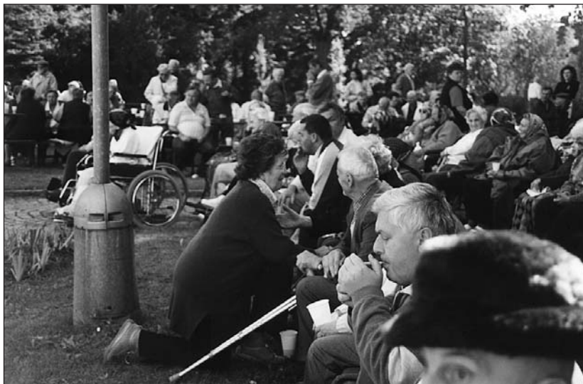
„Zahradní slavnost“ v DD Mitrov a setkání s našimi dobrovolníky