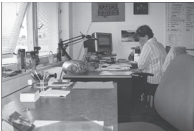
V nových prostorách.

Rok 2004 byl pro HHV úspěšným rokem. O tom, jak se dařilo poskytovat služby lidem, mluvíme jinde v této zprávě. O institucionálním rozvoji HHV řekněme něco málo zde.