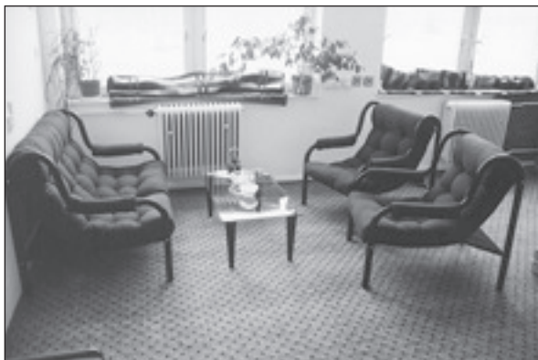
Interiér poradny Alej.