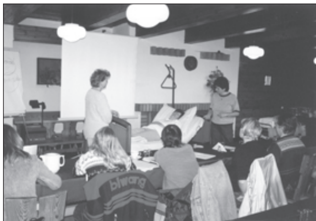
Z jarní části kurzu.

Na rozdíl od předchozího roku, kdy se naše sdružení zaměřilo na komunikaci s potenciálními zájemci o dobrovolnictví, byl rok 2004 ve znamení dalšího vzdělávání dobrovolníků, kteří již v hospicové péči pracují. Pro dobrovolníky HHV a pro dobrovolníky z partnerských hospiců a hospicových sdružení uspořádalo naše sdružení kurz hospicové péče. Tohoto kurzu, trvajícího 2 víkendy, se zúčastnilo celkem 25 dobrovolníků.